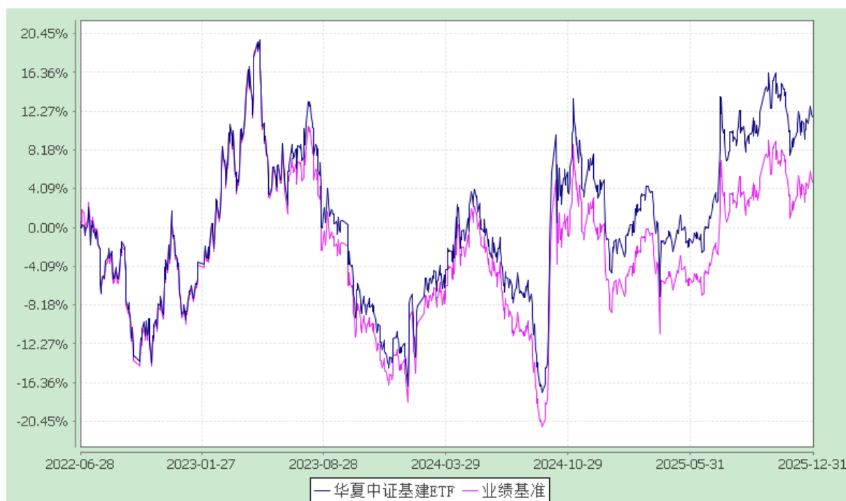
华夏中证基建交易型开放式指数证券投资基金 份额累计净值增长率与业绩比较基准收益率历史走势对比图 (2022年6月28日至2025年12月31日)