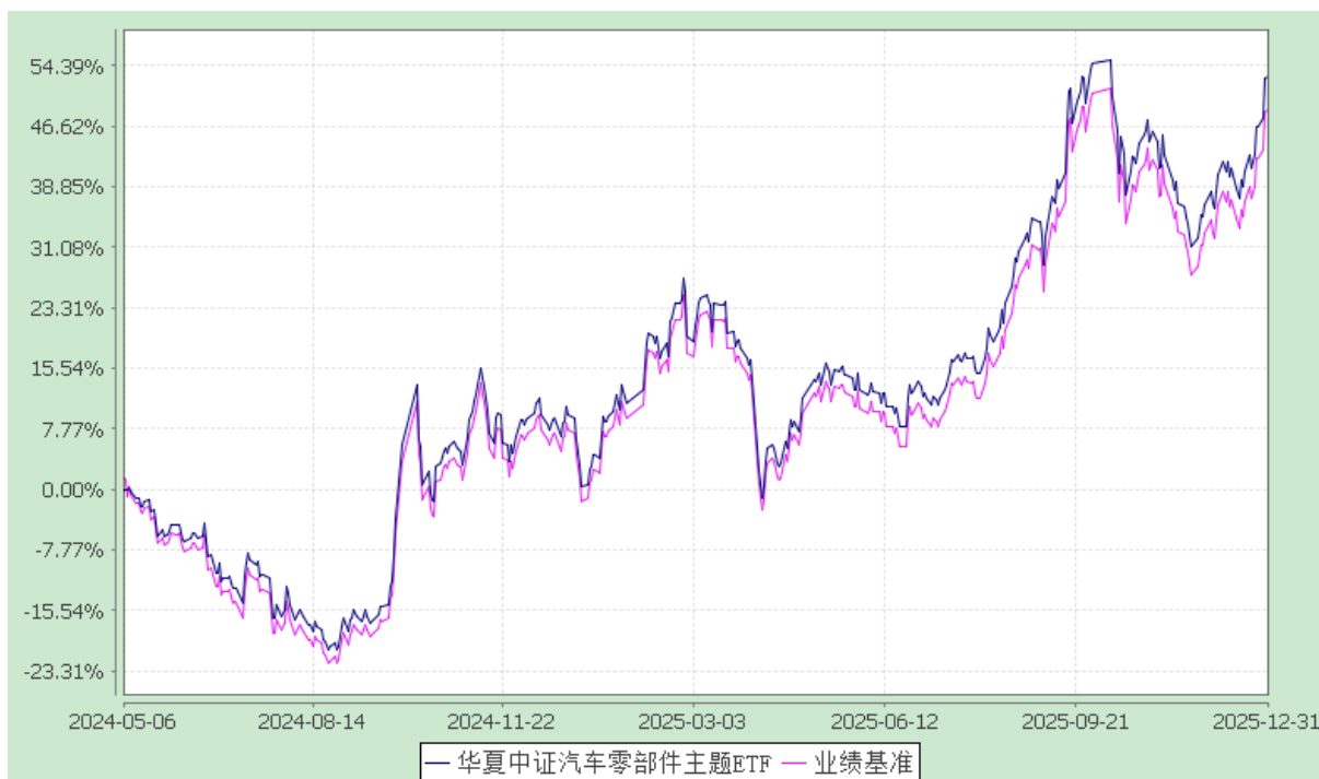
华夏中证汽车零部件主题交易型开放式指数证券投资基金 份额累计净值增长率与业绩比较基准收益率历史走势对比图 (2024年5月6日至2025年12月31日)