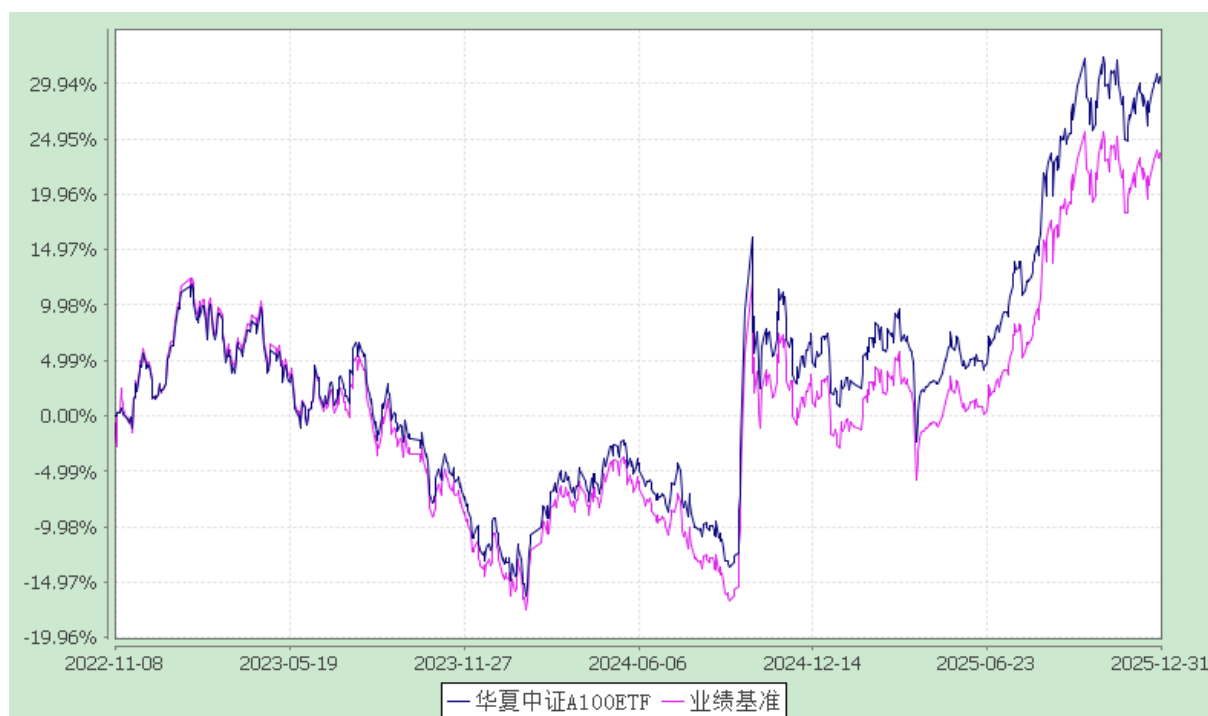
华夏中证 A100 交易型开放式指数证券投资基金 份额累计净值增长率与业绩比较基准收益率历史走势对比图 (2022 年 11 月 8 日至 2025 年 12 月 31 日)