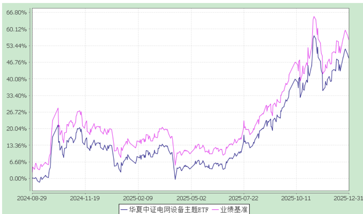
华夏中证电网设备主题交易型开放式指数证券投资基金 份额累计净值增长率与业绩比较基准收益率历史走势对比图 (2024 年 8 月 29 日至 2025 年 12 月 31 日)

注：根据本基金的基金合同规定，本基金自基金合同生效之日起 6 个月内使基金的投资组合比例符合本基金合同中投资范围、投资限制的有关约定。