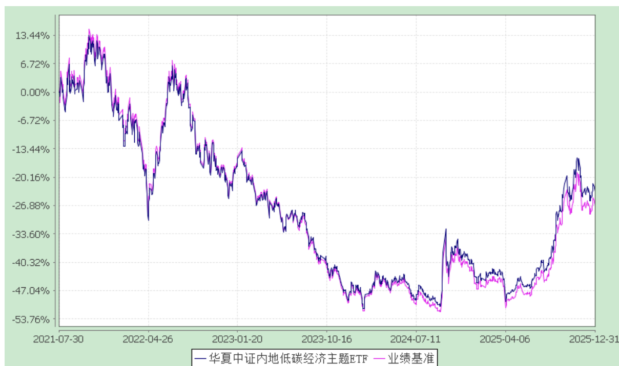
华夏中证内地低碳经济主题交易型开放式指数证券投资基金 份额累计净值增长率与业绩比较基准收益率历史走势对比图 (2021年7月30日至2025年12月31日)