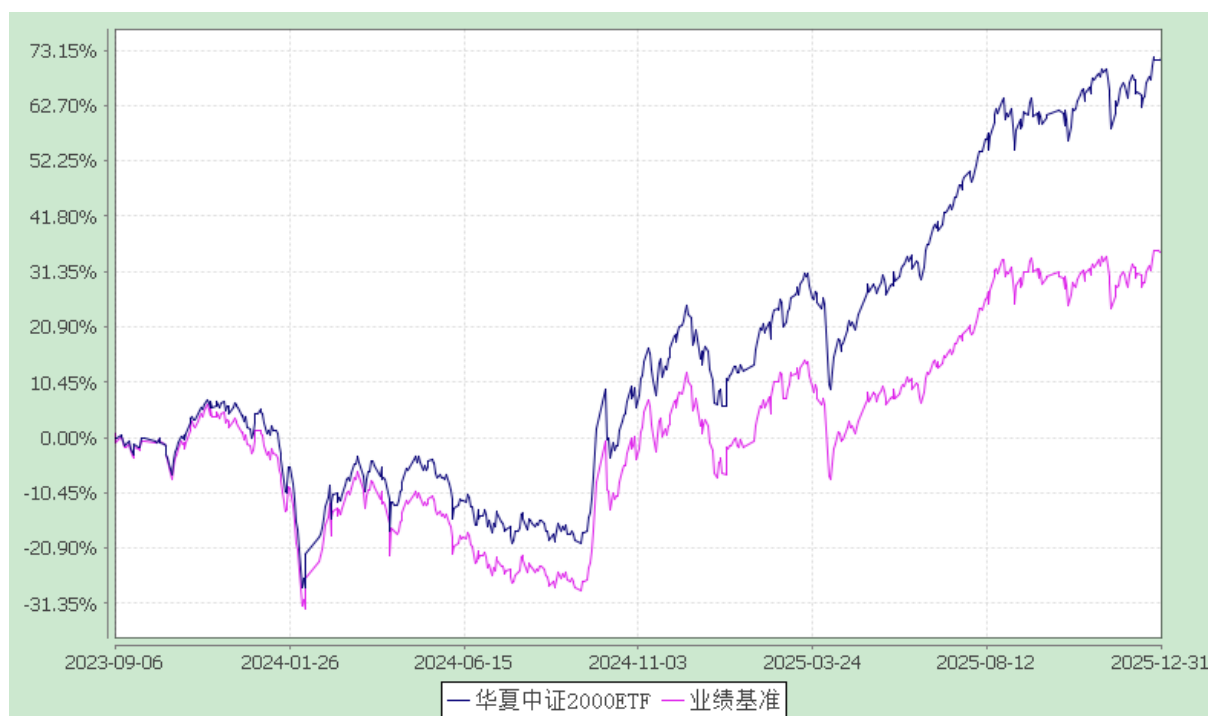
华夏中证 2000 交易型开放式指数证券投资基金 份额累计净值增长率与业绩比较基准收益率历史走势对比图 (2023 年 9 月 6 日至 2025 年 12 月 31 日)