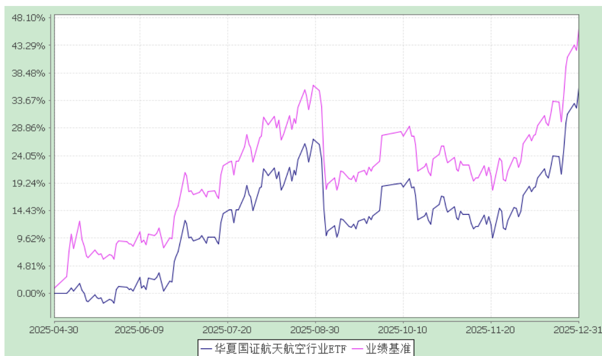
华夏国证航天航空行业交易型开放式指数证券投资基金 份额累计净值增长率与业绩比较基准收益率历史走势对比图 (2025 年 4 月 30 日至 2025 年 12 月 31 日)