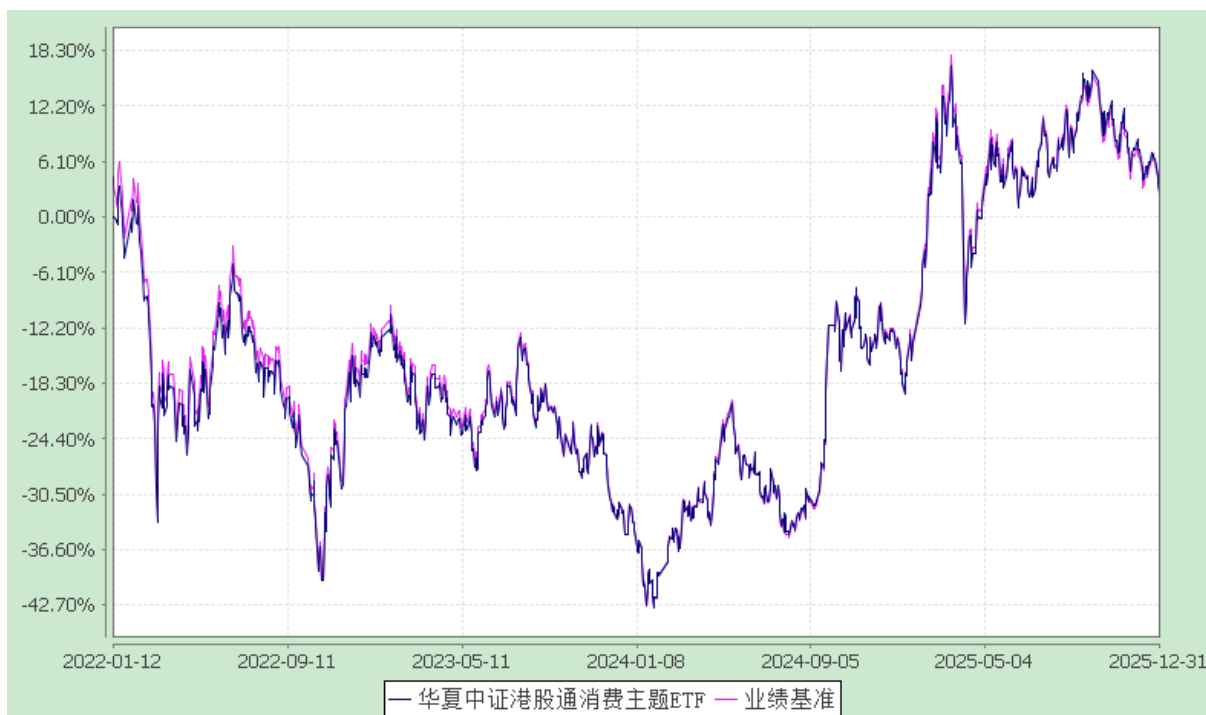
华夏中证港股通消费主题交易型开放式指数证券投资基金 份额累计净值增长率与业绩比较基准收益率历史走势对比图 (2022 年 1 月 12 日至 2025 年 12 月 31 日)