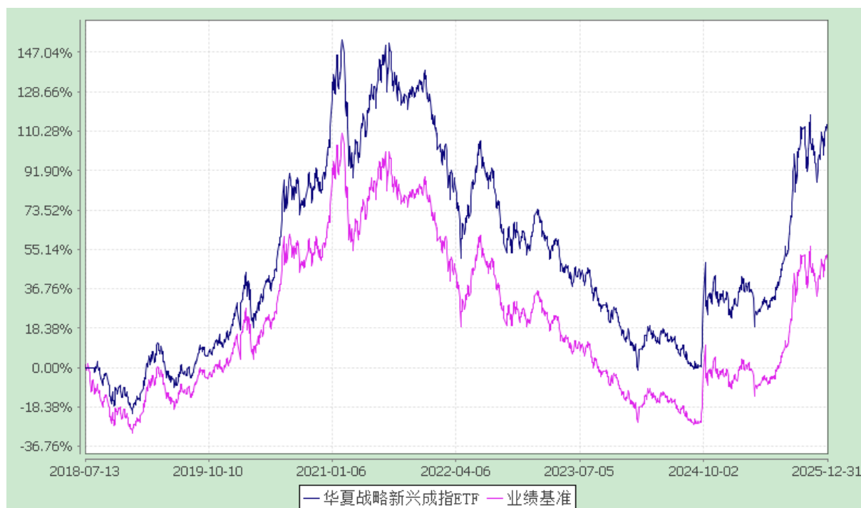
战略新兴成指交易型开放式指数证券投资基金 份额累计净值增长率与业绩比较基准收益率历史走势对比图 (2018年7月13日至2025年12月31日)