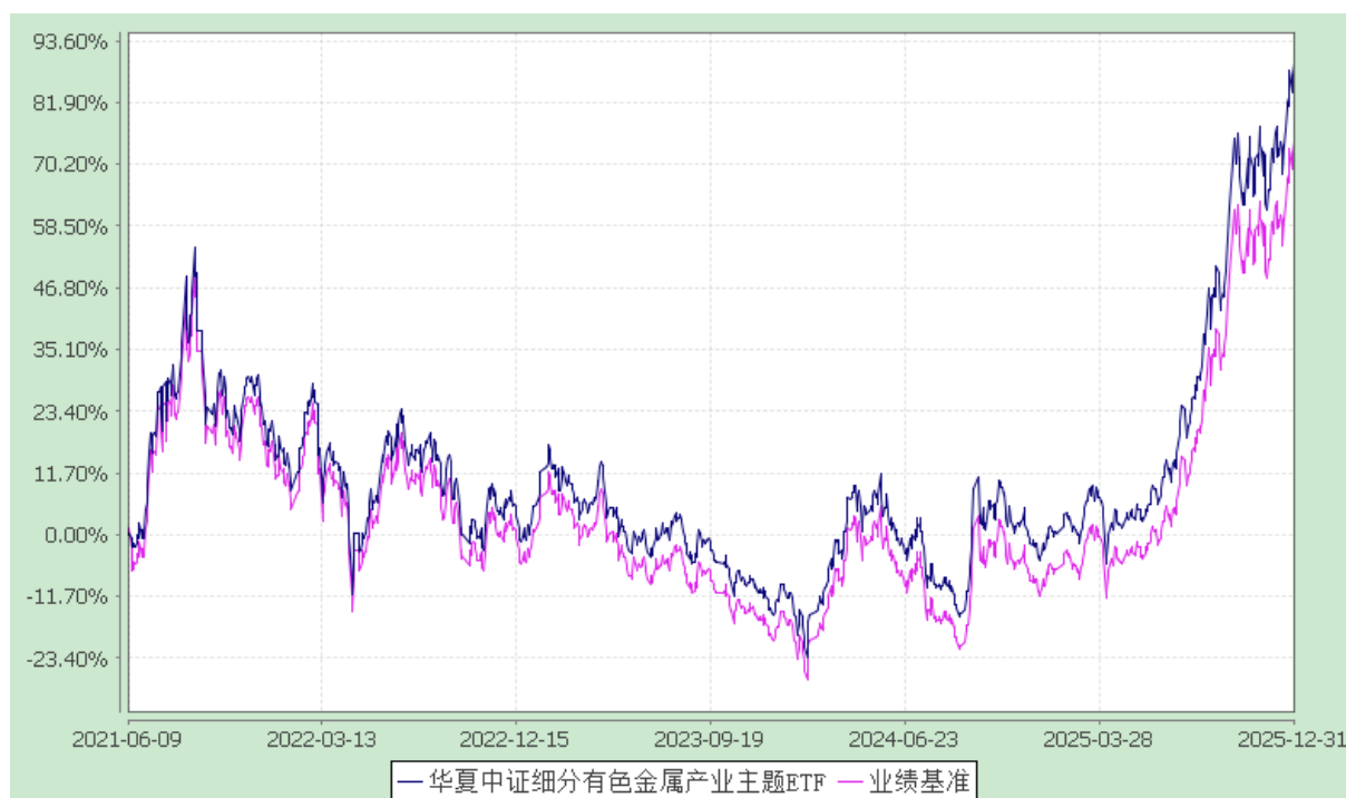
华夏中证细分有色金属产业主题交易型开放式指数证券投资基金 份额累计净值增长率与业绩比较基准收益率历史走势对比图 (2021年6月9日至2025年12月31日)