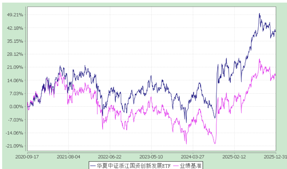
华夏中证浙江国资创新发展交易型开放式指数证券投资基金 份额累计净值增长率与业绩比较基准收益率历史走势对比图 (2020年9月17日至2025年12月31日)