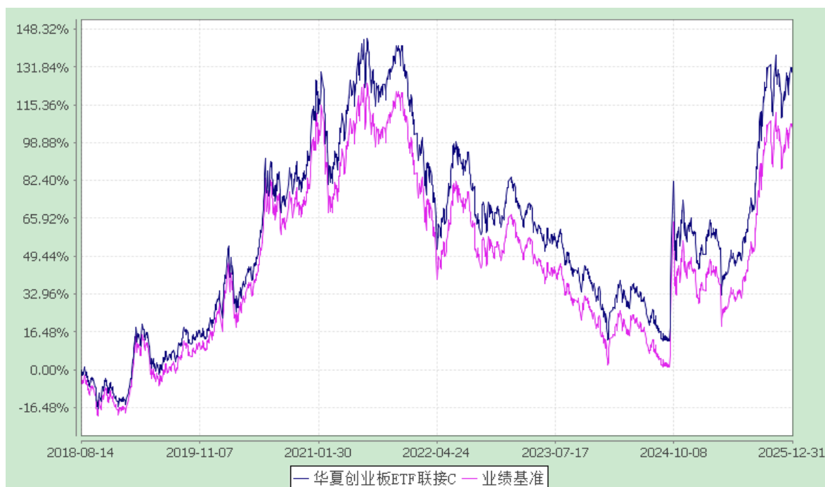
华夏创业板 ETF 联接 Y: